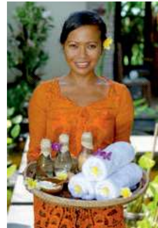
चित्र 1.1 सहायक स्पा थेरपिस्ट

दोनों राष्ट्रीय और वैश्विक स्तर पर बड़ी संगठित कंपनियों के प्रवेश के साथ सौन्दर्य और स्वास्थ्य उद्योग में तीव्र वृद्धि के कारण प्रशिक्षित कार्मिकों हेतु मांग बढ़ी है इस प्रतिभा में कमी के कारण संपूर्ण सौन्दर्य और स्वास्थ्य उद्योग के विकास और विस्तार के समक्ष खतरा उत्पन्न हो गया है इसलिए, दोनों व्यापार और क्षेत्र हेतु कुशल और प्रशिक्षित कार्मिक तैयार करना एक बड़ी चुनौती है।