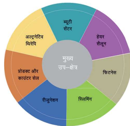
चित्र 1.5 ब्यूटी और वेलनेस उद्योग का वर्गीकरण

स्वास्थ्य और स्लिमिंग – इसमें दी जाने वाली सेवाओं में शारीरिक व्यायाम, योग, मन-शरीर व्यायाम और वजन घटाना और पतला होना शामिल है।