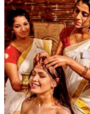
चित्र 1.2 स्पा थेरपिस्ट को मदद करती सहायक स्पा थेरपिस्ट