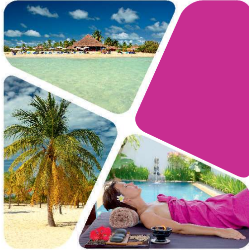
चित्र 1.6 रिजॉर्ट / होटल स्पा

रिजॉर्ट / होटल – पेशेवर ढंग से प्रशासित स्पा सेवाएं फिटनेस और स्वास्थ्य संघटक तथा स्पा क्वीजीन मेनू विकल्प रिजॉर्ट या होटल के भीतर ही उपलब्ध कराते हैं।