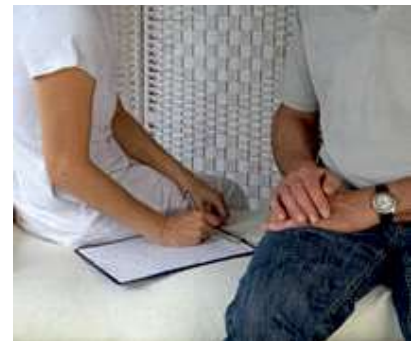
चित्र 2.1 रिकार्ड कार्ड को भरता थेरेपिस्ट