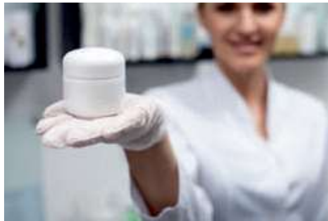
चित्र 1.3 ग्राहक को उपयुक्त उत्पाद प्रदान करना