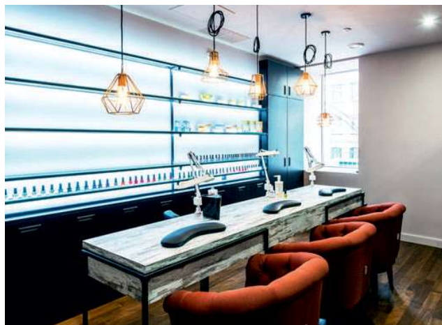
चित्र 2.2- नेल सैलून