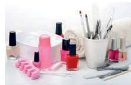
चित्र 1.3- सहायक नेल तकनीशियन के उपकरण और सामग्री