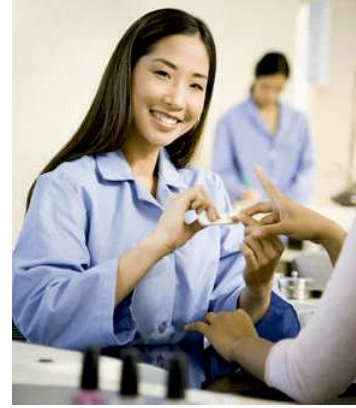
चित्र 1.1- सहायक नेल तकनीशियन

राष्ट्रीय और अन्तर्राष्ट्रीय स्तर पर बड़े ब्रांडों के आने के साथ-साथ ब्यूटी और वेलनेस उद्योग तेजी से बढ़ा है जिसके कारण इस क्षेत्र में काम करने के लिये प्रशिक्षित लोगों की भारी मांग है। जबकि, सच्चाई यह है कि कुशल और प्रशिक्षित काम करने वालों की बहुत ज्यादा कमी है। इस क्षेत्र में प्रतिभा या कुशल काम करने वालों की कमी ने पूरे ब्यूटी और वेलनेस उद्योग के विस्तार और विकास में सबसे बड़ी रुकावट खड़ी की है। कुशल और प्रशिक्षित काम करने वालों की कमी को पूरा करना इस क्षेत्र से जुड़े बिजनेस और प्रशिक्षण पर काम करने वाली संस्थाओं के सामने सबसे बड़ी चुनौती है।