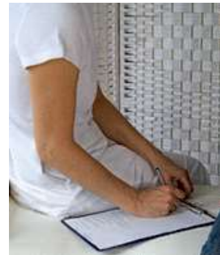
चित्र 2.1- रिकॉर्ड कार्ड भरना