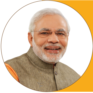
श्री नरेन्द्र मोदी प्रधानमंत्री, भारत सरकार

“ कौशल से बेहतर भारत का निर्माण होता है। यदि हमे भारत को विकास की ओर ले जाना है तो कौशल का विकास हमारा मिशन होना चाहिए। ”